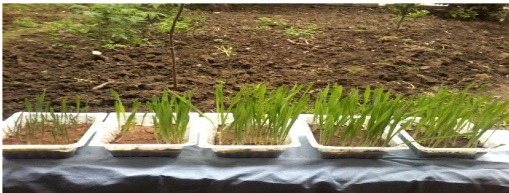
Şək. 3. Gəncə Alüminium zavodu ərazisindən yığılmış alüminium tozlarından hazırlanmış müxtəlif qarışımlarda cücərdilmiş buğda toxumları

Sonrakı təcrübələrdə (ikinci üsul) Gəncə Alüminium zavodu ərazisindən yığılmış alüminium tozlarından müxtəlif faizli torpaq qarışımları hazırlanmış və həmin qarışımlarda buğda cücərdilmiş və onların kontrola (“Xan bağı” ərazisindən götürülmüş torpaq) nəzərən müqayisəsi aparılmışdır (Şəkil 3).