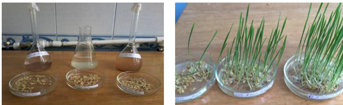
Şək. 1. Gəncə Alüminium zavodu ərazisindən yığılmış alüminium tozlarından hazırlanmış müxtəlif qatılıqlı məhlullarla cücərdilmiş buğda toxumları

Aşağıdakı şəkildə biz onların boy artımlarında və cücərmə faizlərində yaranan fərqi aydın görürük. Soldan birinci adi su ilə yetişdirilən buğda cücərtisi, ikinci 0,4%, sonuncu isə 1% -li məhlulla sulanan buğda cücərtisidir.